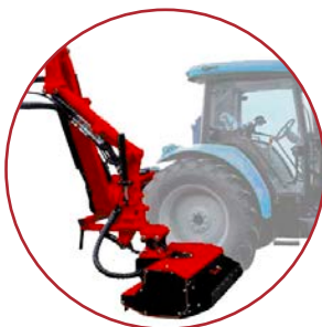
Braccio con snodo per taglio avanzato Arm with joint for advanced cutting