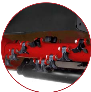
DI SERIE | STANDARD Accumulatore oleopneumatico Oleo-pneumatic accumulator