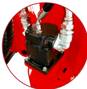
Impianto idraulico ad ingranaggi hydraulic system