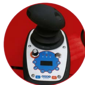
Comandi proporzionali Proportional controls