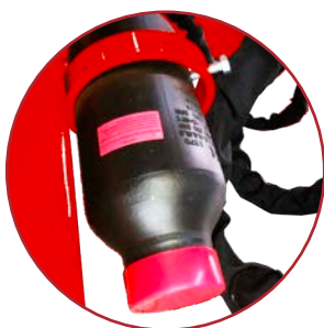
Accumulatore oleopneumatico Oleo-pneumatic accumulator