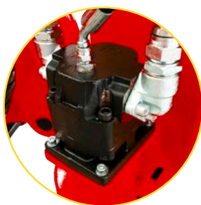
Impianto idraulico ad ingranaggi Hydraulic system