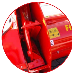
Sistema doppio taglio Double chop system