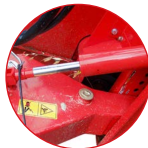
Regolazione di taglio Cut adjustment