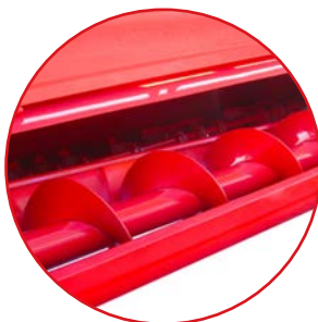
Coclea di trasporto Transport auger