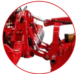
Heckanhängung an der zentralen Maschine