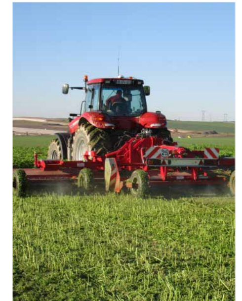
CUNEO PX MIT RÄDERN

SONDERAUSFÜHRUNG FÜR UMKEHRBAREN TRAKTOR