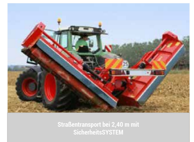
Straßentransport bei 2,40 m mit SicherheitsSYSTEM