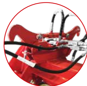
OPTIONAL HYDRAULISCHE VERRIEGELUNG