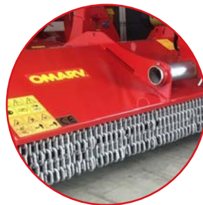
(OPTIONAL) Catene Chains