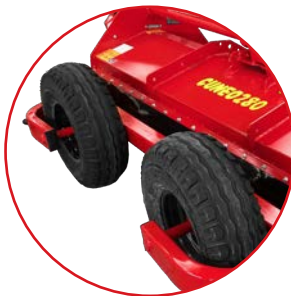
(OPTIONAL) Ruote Wheels