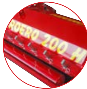
Kit rastrelli Rakes kit