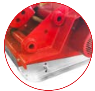
Slitte laterali regolabili Adjustable side skids